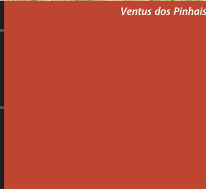
Ventus dos Pinhais